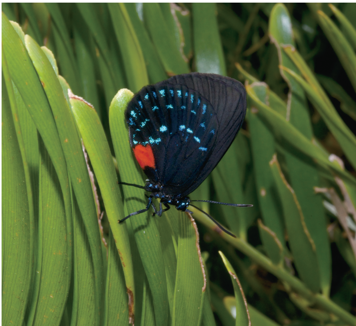
▲ Eumaeus atala (Florida, USA)